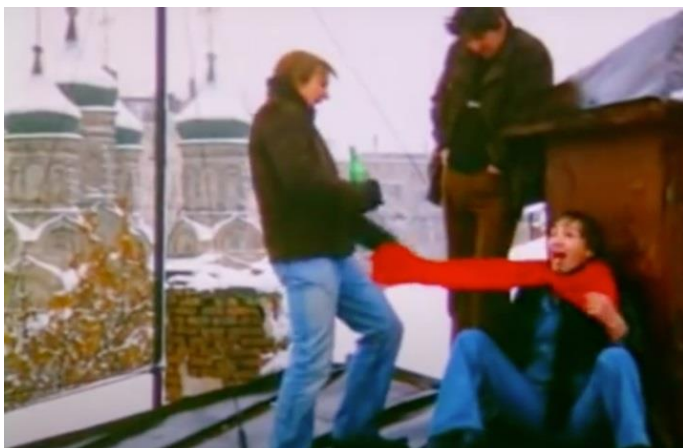
Кадр из фильма «Русский регтайм». 1993 г.