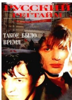
Афиша фильма «Русский регтайм». 1993 г.