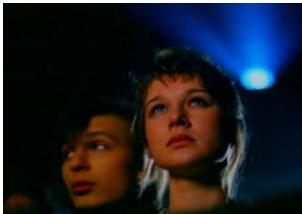
Дмитрий Марьянов и Дарья Михайлова. Кадр из кинофильма «Русский регтайм». 1993 г.

А еще не думаю, что Димка был «пионер всем ребятам пример». Например, ни разу не опоздал. Возможно, были какие-то дисциплинарные нарушения, по крайней мере, я слышал об этом. В любом случае, в Ленкоме он был не сильно задействован. Уж точно, не соответственно его таланту. Зато я видел его во многих картинах, и пусть эти работы не особо радовали меня своей глубиной, важно, что он не исчез, не канул. В силу разных обстоятельств, никак не личных, у меня не было варианта опять позвать его в работу. Не складывалось — так бывает. Ты любишь кого-то как артиста и по-человечески ценишь, а не зовешь — не находишь применения. И есть те, которые тебе не так уж и близки, но ты зовешь их в работу раз за разом. Какой-то артист у тебя вдруг снимается и снимается. Даже не знаешь, что с этим делать!