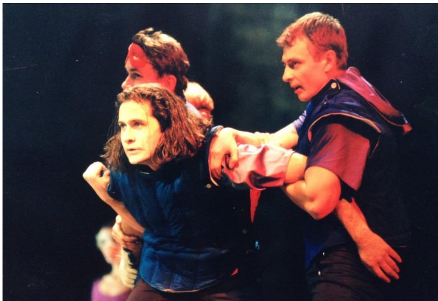
РАМТ. Спектакль «Ромео и Джульетта». Режиссер-постановщик и исполнитель роли Тибальта — Михаил Шевчук. 1999 г.

Обязательный номер у Димы в программе — страдания. Он очень переживал по поводу своих отношений. Рано или поздно, но раз в день открывался «Клуб разбитых сердец». Я не видел ни одного его краха. Со стороны казалось, что у него в личной жизни все и всегда замечательным образом складывается. Более чем! Везунчик! Но на самом деле он очень много времени проводил в своих переживаниях и в размышлениях о любви. Только я никогда не знал, о ком он конкретно говорит. При всей его бесшабашности в сердечных делах он был крайне скрытным.