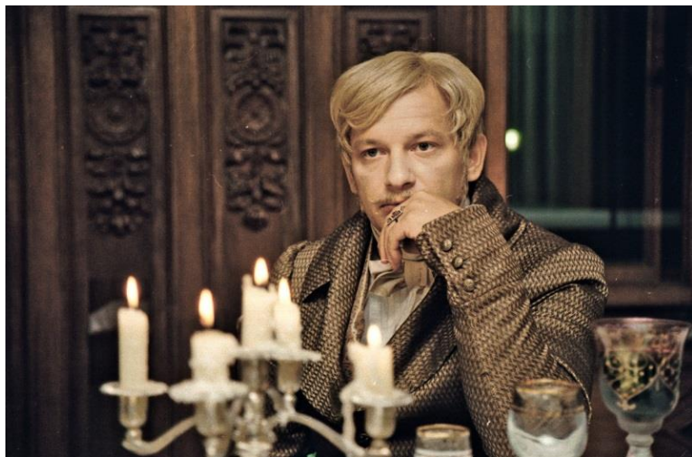
Кадр из многосерийного художественного фильма «Сатисфакция». 2003 г.