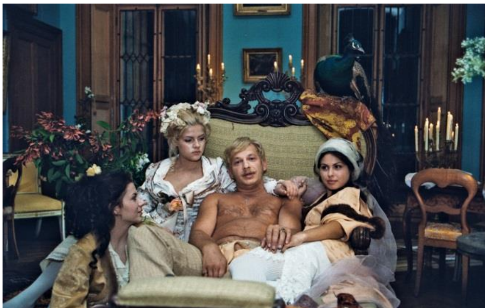
Фотография со съемочной площадки многосерийного художественного фильма «Сатисфакция». 2003 г.