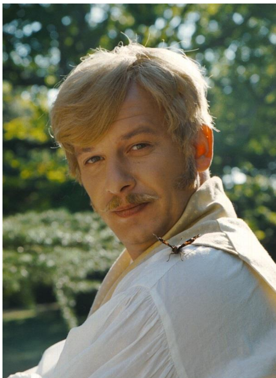
Фотография со съемочной площадки многосерийного художественного фильма «Сатисфакция». 2003 г.