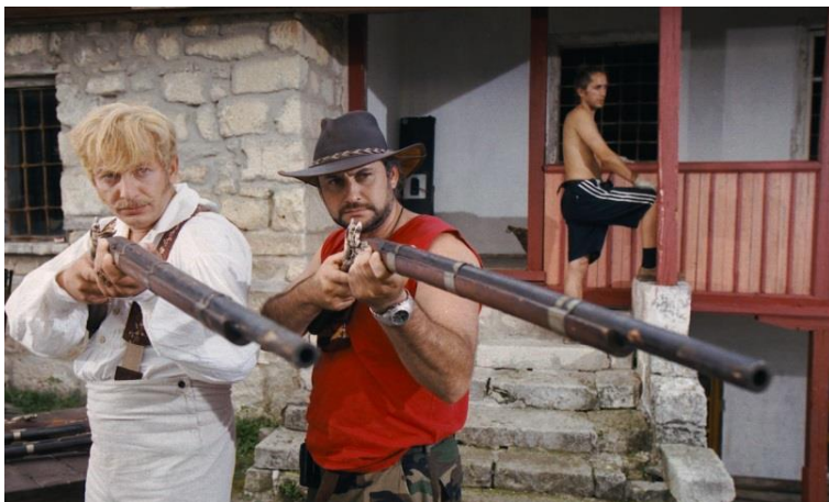
Фотография со съемочной площадки многосерийного художественного фильма «Сатисфакция». 2003 г.

Эротическая программа. Ночной эфир. Аналог тележурнала «Playboy». Мы придумали целый ворох короткометражек. Один цикл почему-то запомнился (наверное, потому что он был самый нелепый) — назывался «Капли Марата». Про придурка — студента-химика. В ходе каких-то экспериментов он случайно изобретает особый раствор: если женщина даже несколько капель с водой выпивает, тотчас начинает читать мысли мужчины и исполнять все его прихоти, делать все, что он только захочет. Марат подрабатывает тренером в спортивном клубе и таким образом обнаруживает уникальные свойства этой жидкости. Вся драматургия строилась на том, что он полный кретин, ну вот такой — ученый, поэтому все желания у него дурацкие. Целый цикл юмористических эротических рассказов получился. Канал так и не решился программу снимать, но после победы в этом тендере мы ощущали себя, будто «Оскара» взяли.