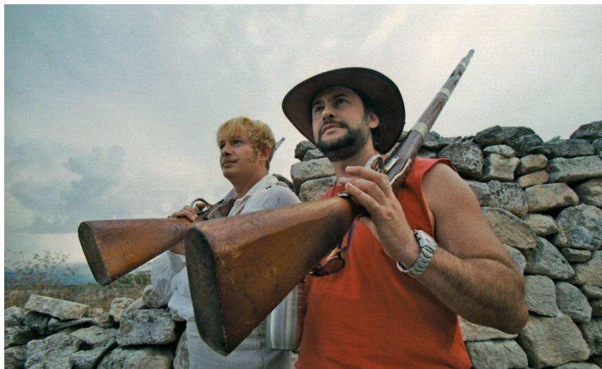
Фотография со съемочной площадки многосерийного художественного фильма «Сатисфакция». 2003 г.