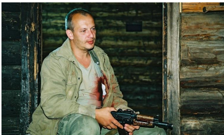
На съемочной площадке многосерийной кинокартины «Главный калибр». 2006 г.