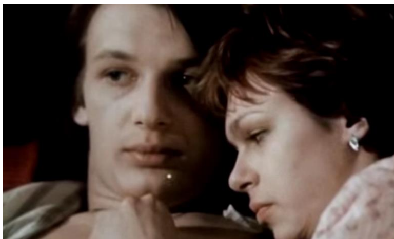
Кадр из кинофильма «Любовь». Режиссер В. Тодоровский. 1991

В том же году меня утвердили в фильме «Любовь» Валеры Тодоровского. Это 1989. Все было очень серьезно. Шел кропотливый отбор актеров, пробы, переговоры. Я уж думал, сейчас буду монологи толкать. Оказалось, такой жесткий кастинг шел на массовку. И мелькаю я там один раз где-то на заднем плане, в ванной с кем-то целуюсь. В главной роли, в одной из — тот самый — Дмитрий Марьянов. Мы не общались, но я увидел это явление природы близко. И меня начало перекашивать, может, даже из зависти, из ревности — я пытался в нем найти хоть что-то неправильное, что-нибудь отталкивающее. И решил: Дима не наш, какой-то он импортный .