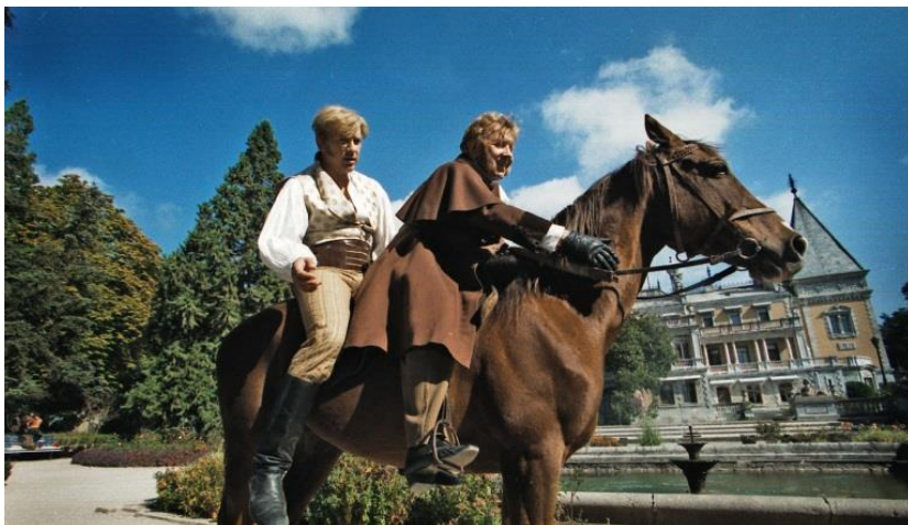
Фотография со съемочной площадки многосерийного художественного фильма «Сатисфакция». 2003 г.

И это было время, когда обрушилась страна. Прямо на наших глазах. Прямо нам на голову. Рухнула и вся индустрия. Было даже жутковато идти по совершенно пустому «Мосфильму». Огромные корпуса — гигантская, крупнейшая в стране фабрика грез, и ничего не снималось. Единственная картина в запуске — «Графиня де Монсоро». Кстати, кино у нас ведь так и не восстановилось. Пятнадцать лет безмолвия не прошли даром. Мы потеряли школу во всех профессиях — нет операторов, художников, сценаристов, режиссеров, гримеров и так далее. Это трагедия. Осталась горстка профессионалов, и они не успели школу передать. Все тогда будто испарилось — на «Мосфильме» ни души. И вот спрыгиваешь с лошади, выныриваешь из драк и погонь, отстегиваешь шпагу, а потом долго идешь по пустующей, полузаброшенной студии, выходишь и... вокруг тебя — Перестройка. Дурь какая-то творится. Мы придумали тогда для себя особый образ жизни. Называли его ковбой-панк: утром в седло, вечером в говно. В ночи просто падали. А раннее утро мы с ним проводили в спорткомплексе «Олимпийский». Занимались акробатикой и всяким спортом, плавали. Чтобы хоть немножко прийти в себя. Потом ехали на съемки или на спектакль. А после сразу же опять встречались, общались — обменивались идеями, а потом вперед! В клуб или в гости — хулиганить. Рано утром опять на спорте. Вот такой круглосуточный график. Мушкетерские забавы.