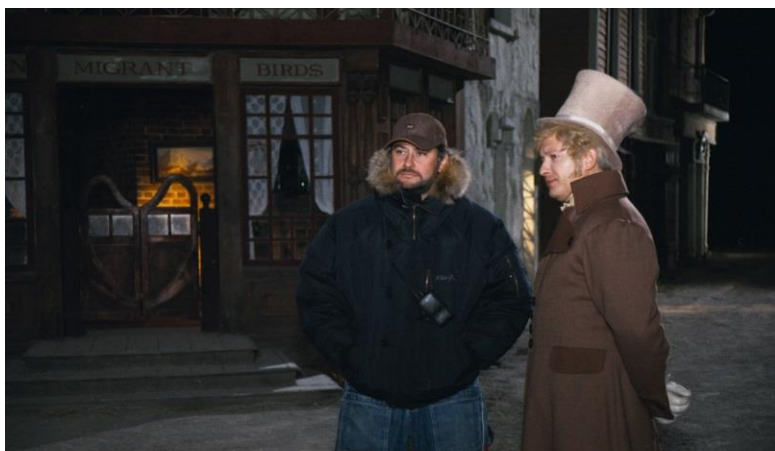
Фотография со съемочной площадки многосерийного художественного фильма «Сатисфакция». 2003 г.