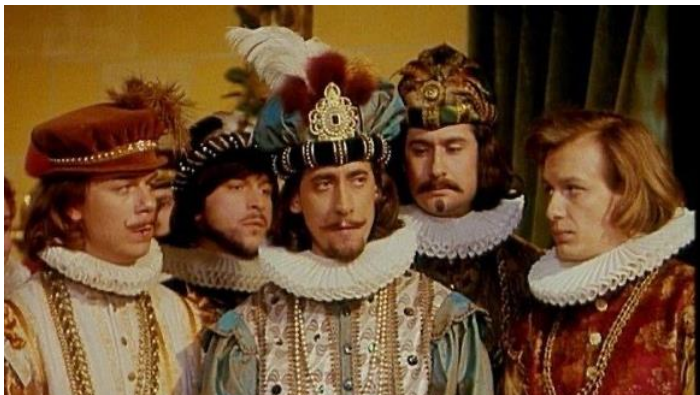
Фотография со съемочной площадки фильма «Графиня де Монсоро». 1995 г.

Снимали на пленку. Пленка — это ответственно. Пленка — это когда все и все делают с первого раза. Но Дима... Точнее его шпага, которая красовалась на боку. Всякий раз, когда он особенно темпераментно входил в дверь, то клинок цеплялся за косяк и фланберга вставала поперек двери. Ручка у нее тяжелая, ее заклинивает — шпага резко перед Димой поднималась, и он через нее кувыркался. И так было несколько раз. В такие моменты жалеешь, конечно, что не цифра. Можно было бы сохранить, скачать. А тогда бракованные дубли даже не проявляли. Кино — вообще тогда было настоящее таинство. Только на монтажном столе режиссер мог увидеть кадр и не всякий дубль.