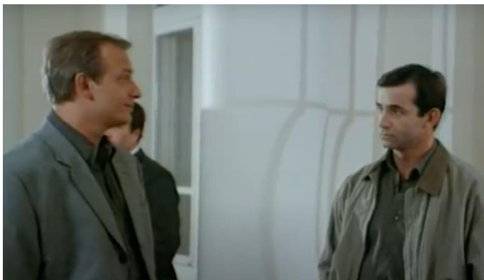
Дмитрий Марьянов и Дмитрий Певцов. Кадр из кинофильма «Львиная доля». 2001 г.

понимаешь, что перед тобой умный, глубокий, трагический и очень талантливый человек, всё вместе. Трюки, драки — это всё понятно, мы все это проходили. А вот вырасти в такого артиста, каким стал Дима, немногие могут. В сюжете «Слушая тишину» всё просто, скупо, но там есть история человека, которая мощнейшим образом рассказана Диминой индивидуальностью. Это останавливает тебя и заставляет думать.