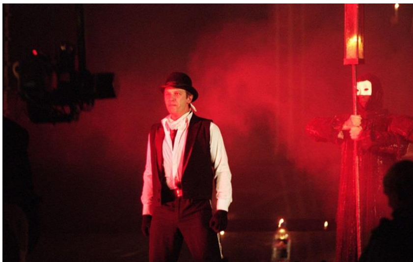
Дмитрий Марьянов в спектакле «Юнона и Авось» 1997 г.

Работать с ним было очень интересно, весело и неожиданно. У него, мне кажется, была природная потребность шутить. И он это умел, делал это хорошо и на сцене, и в жизни. Помню, в Питере у нас были гастроли, и у меня там случился день рождения, круглая цифра — 35. Дима пришел утром и подарил мне маленького стеклянного котенка — а я в год кота родился. И в течение дня он мне подарил их еще штук десять — все были разноцветные — он подходил и вручал одного за другим. Вот такая была забавная штука.