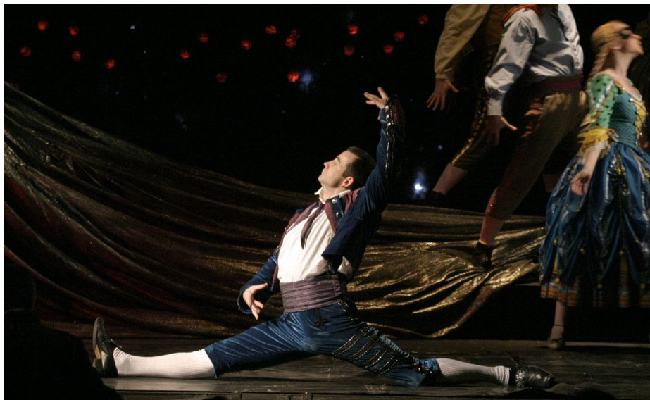
Дмитрий Певцов. Сцена из спектакля «Женитьба Фигаро». 2000 г.

один. Что-то его грызло, не знаю, что это за сомнения и какие вины были у него внутренние. Но это его разнесло. И никто не мог остановить это. Как и Высоцкого никто не мог остановить. К сожалению, тут никто не поможет — ни любимая женщина, ни коллектив, никто не спасет. Страсти идут к самому талантливому, самому светлому, самому опасному. К тому, что дает любовь и радость, а Димка был в этом смысле редким человеком. Он был мужиком. Среди артистов мало мужиков, их практически в этой профессии нет. Я много знаю артистов, хороших, гениальных, популярных, но мужиков среди них я могу пересчитать по пальцам одной руки. Дима один из них. Быть мужчиной-артистом — это значит не быть артистом в жизни. Хотя он любил шутки и приколы, но он никогда не был бытовым Артистычем, который должен быть в центре внимания. Дима очень искренне и по-человечески, душевно существовал вне профессии, не на сцене, и от него шло ощущение, что он нормальный, настоящий. Среди артистов реально мало таких людей. И, может быть, вот это его «я мужик, я всё решу» и стало фатальным.