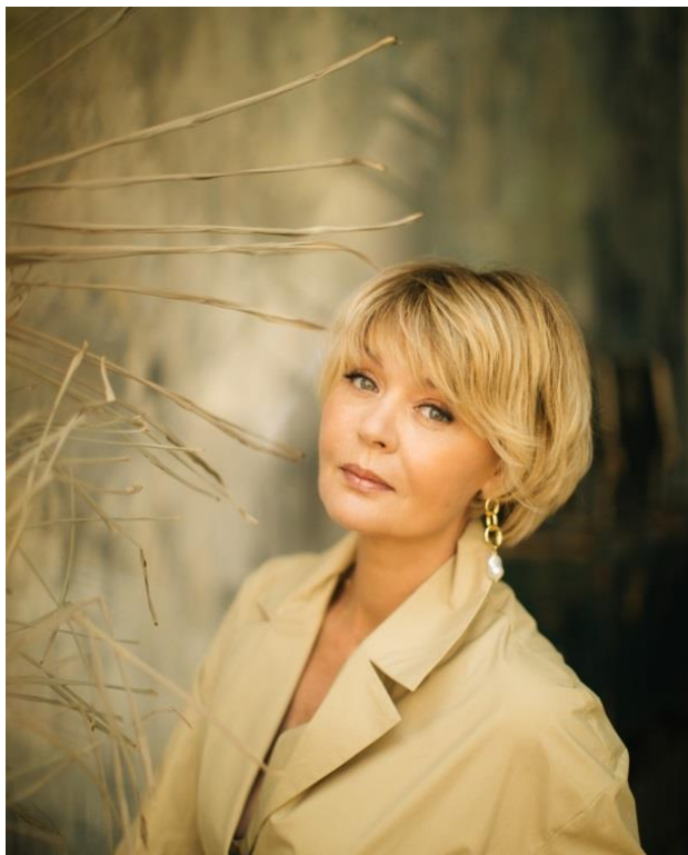
Юлия Владимировна Меньшова. 2015 г.

Актриса театра и кино, режиссер, продюсер, телеведущая. Лауреат национальной телевизионной премии «ТЭФИ»