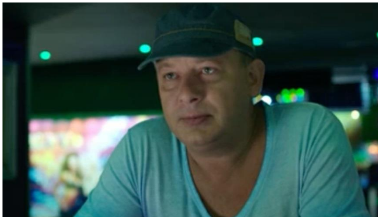
Кадр из сериала «Небесный суд». 2014 г.