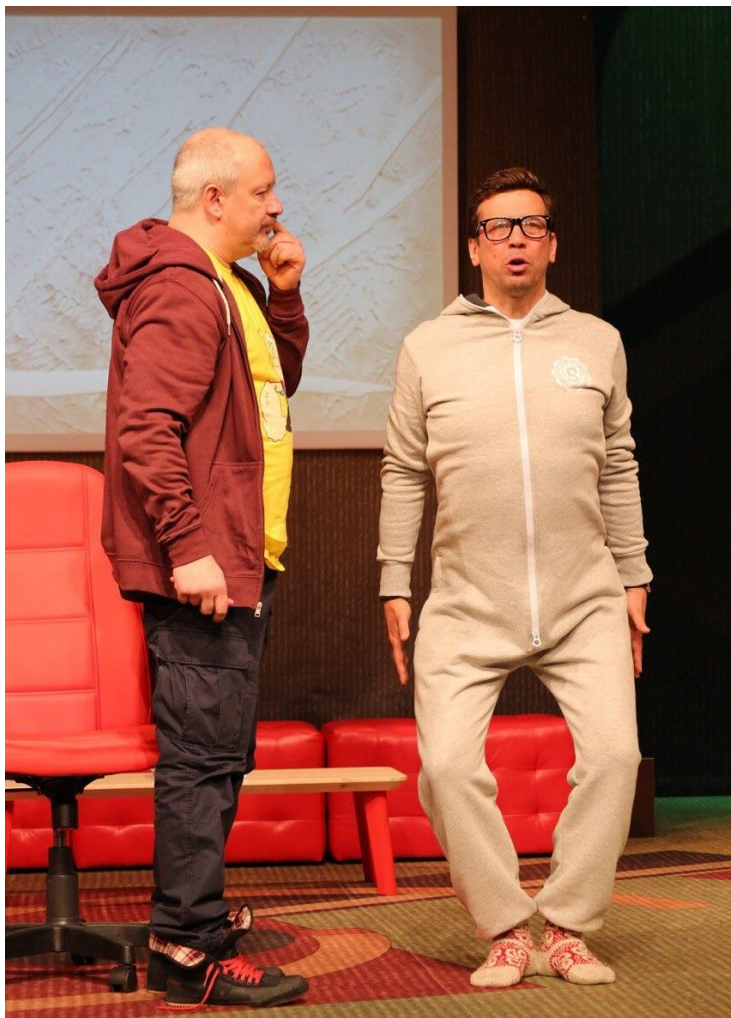
Сцена из спектакля «Друзья». Дмитрий Марьянов и Андрей Мерзликин. 2016 г.

Но появление Димы, наоборот, принесло облегчение.