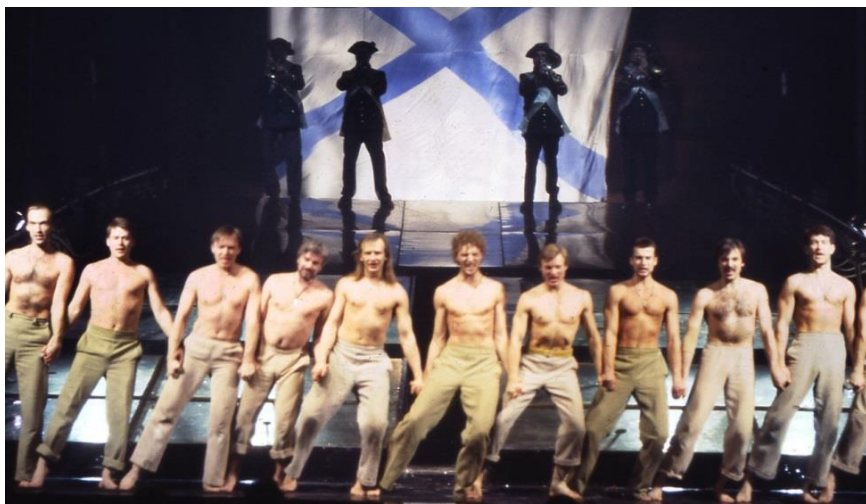
Ленком. Сцена из спектакля «Юнона и Авось». 1994 г.

Нет, не могу сказать, что я сразу потеряла голову. Я привыкла к мужскому вниманию. И в то время у меня был роман. Дима все это знал, видел. Я повторяла ему: «Я не могу ответить тебе взаимностью. Ты должен это понимать». Он отвечал с улыбкой: «Я тебя дождусь». Мы очень медленно приближались друг к другу. После объяснения даже стали реже встречаться. Просто гуляли иногда, или он звал меня в театр. Он всегда вел себя очень скромно, а теперь даже еще сдержаннее — был просто счастлив, если мог, прощаясь, взять меня за руку. И я смотрела на него и думала, какой же он замечательный — офигенский ведь человек! Я влюбилась в Диму за его скромность.