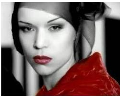
Кадр из клипа на песню Д. Маликова «Нет, ты не для меня». 1994 г.